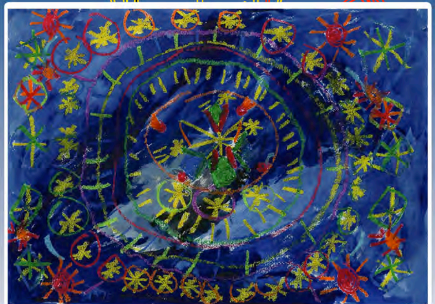
流星群と太陽のかけら